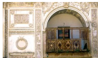
(Ex Chiesa Madre - tribuna interna)

Oggi all'interno dell'ex Chiesa Madre è stato allestito il Museo della Memoria , dove attraverso un percorso di immagini fotografiche ed un filmato audio-visivo è possibile rivedere alcune drammatiche scene del sisma del 1968 che ha colpito tutta la Valle del Belice.