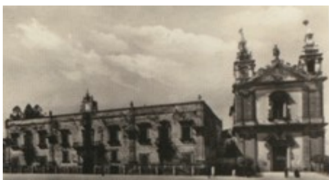
( Il Palazzo prima del 1968)

Così descrive il Palazzo nel romanzo: "Il Palazzo Salina era attiguo alla Chiesa Madre. La sua breve facciata con sette balconi sulla piazza non faceva supporre la sua smisuratezza che si estendeva indietro per duecento metri: erano dei fabbricati di stili differenti, armoniosamente uniti però intorno a tre vasti cortili e terminanti in un ampio giardino tutto cintato." ( da IL GATTOPARDO) Il Palazzo è stato parzialmente distrutto dal sisma del 1968, ristrutturato oggi è sede del "Parco del Gattopardo".