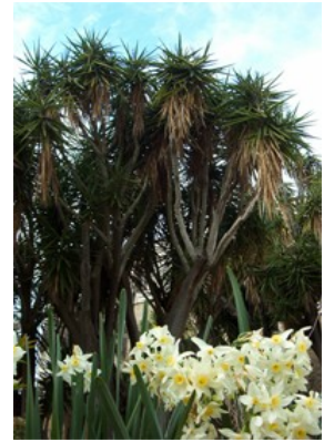
(Il Giardino: particolari)

Il giardino è noto non solo per il suo potenziale evocativo letterario, ma soprattutto per le rare essenze arboree e per la rigogliosa vegetazione.